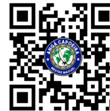
Santo Antonio quero agua

Quero água pra beber Quero água pra lavar Quero água pra benzer Quero água