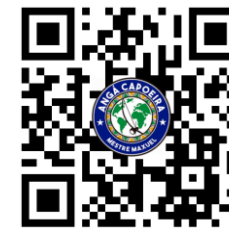
Eu vou botar minha rede na varanda

Eu vou botar minha rede na varanda Eu quero ver minha rede balançar Balança rede ioio Balança rede iaia