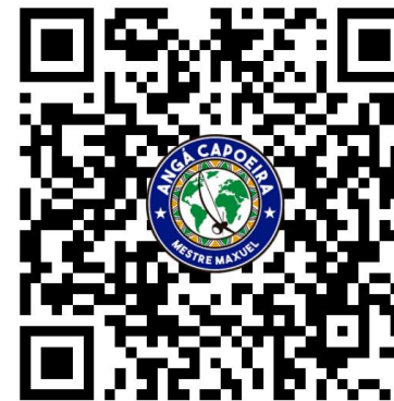
Playlist Anga Capoeira Lille